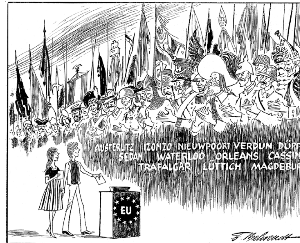
2 Die Demokratie eint die europäischen Völker

In der „Frankfurter Allgemeinen Zeitung“ am 9. Juni 1979 veröffentlichte Zeichnung von Fritz Behrendt. Vom 7. bis 10. Juni 1979 wählten die europäischen Bürger zum ersten Mal in einer Direktwahl das Europäische Parlament von Straßburg. So wurden Victor Hugos visionäre Worte einhundertdreißig Jahre später Wirklichkeit: „Ein Tag wird kommen, an dem es keine anderen Schlachtfelder mehr geben wird als die Märkte, die sich dem Handel öffnen, und die Geister, die sich den Ideen öffnen. Ein Tag wird kommen, an dem das allgemeine Wahlrecht der Völker Kugeln und Bomben durch Wahlzettel ersetzen wird.“ (Eröffnungsansprache auf dem Friedenskongress, 21. August 1849)